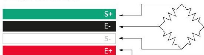
Código de colores